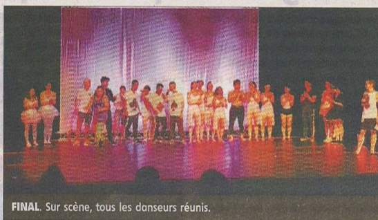
FINAL. Sur scène, tous les danseurs réunis.