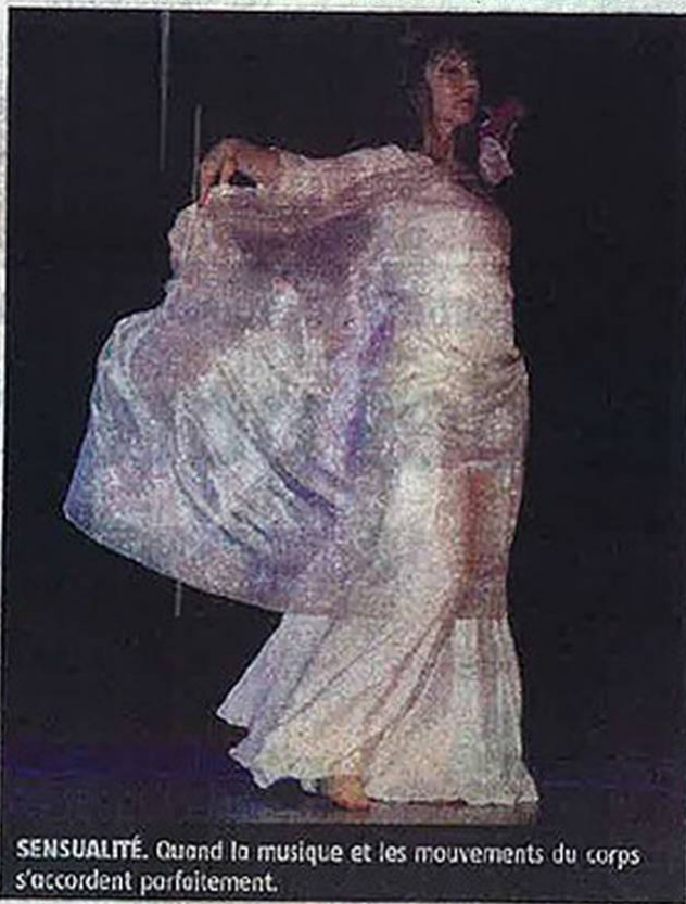
SENSUALITÉ. Quand la musique et les mouvements du corps s'accordent parfaitement.

Après cette sublime mélodie qui a donné le frisson aux spectateurs, changement d'ambiance avec Unik Dreamers, un groupe de Bboys issu de la section hip-hop briaraise qui a